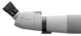
TSN-663 PROMINAR XD Lens, Angled TSN-663 プロミナー XDレンズ 傾斜型