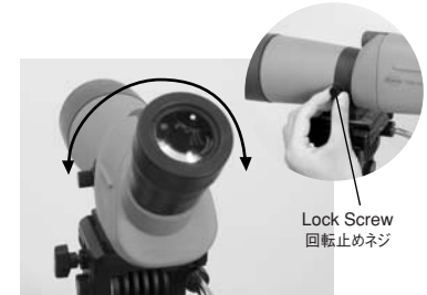
Lock Screw 回転止めネジ

回転止めネジを反時計回りに回して緩めると、三脚に固定したまま、見たい位置にスコープ本体を回転できます。(可動範囲は360°)